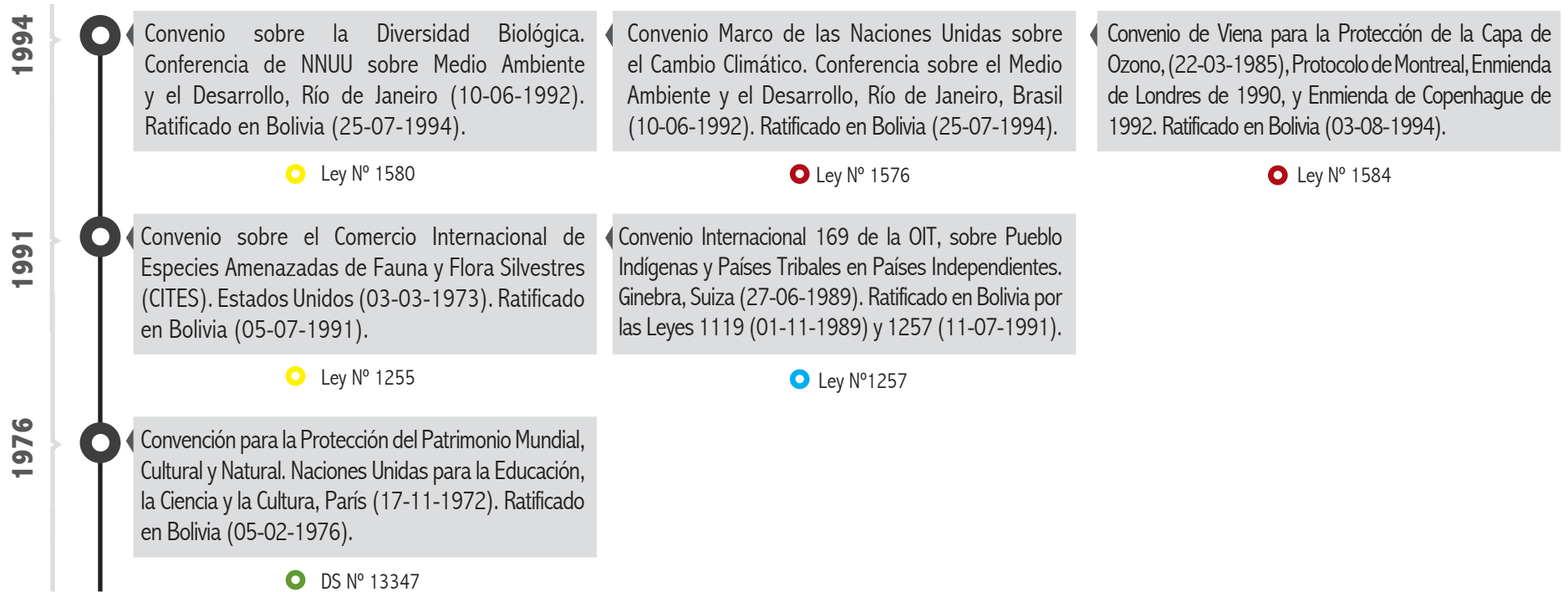
Figura 4. Leyes, Reglamentos y Decretos Supremos aprobados en el contexto nacional y relacionados al contenido del atlas