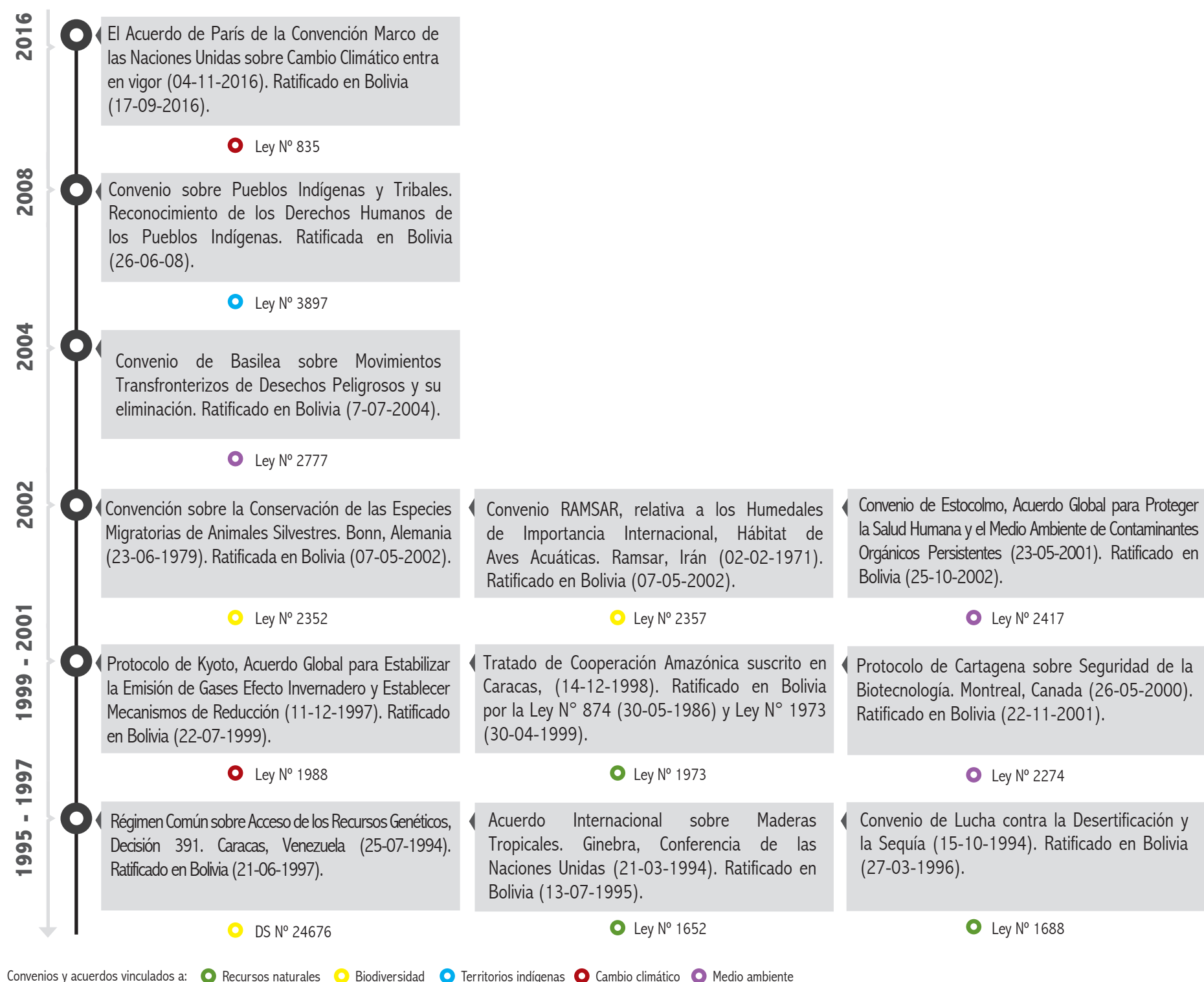
Figura 3. Convenios y acuerdos internacionales ratificados por Bolivia a través de Leyes y Decretos Supremos

En el contexto nacional, se incluyen los instrumentos legales para el acceso, uso y control de los recursos naturales y la biodiversidad. Asimismo, aquellos que son de interés al contenido e interpretación de indicadores y resultados del atlas en sinergia con el marco conceptual Presión-Estado-Respuesta-Beneficio , adoptado para el estudio cartográfico socioambiental (Figura 4).