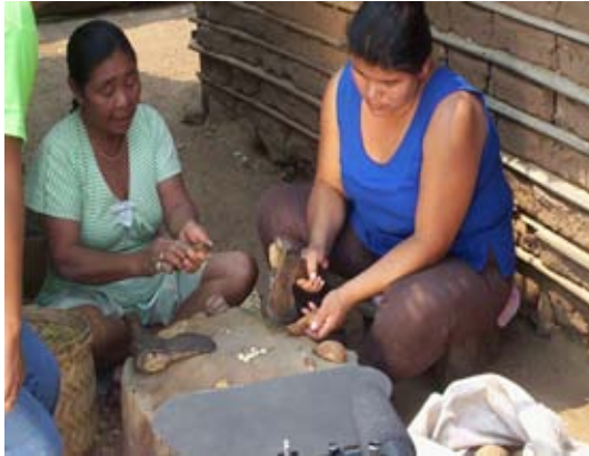
Mujeres guarayas con semilla de cusi