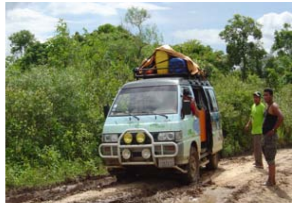
El "Lagarto Viajero" en el Beni

Se sistematizó la capacitación en manejo de fauna silvestre y la Unidad Móvil de Capacitación "Lagarto Viajero" fue implementada habiendo realizado dos giras en 8 comunidades en el Beni.