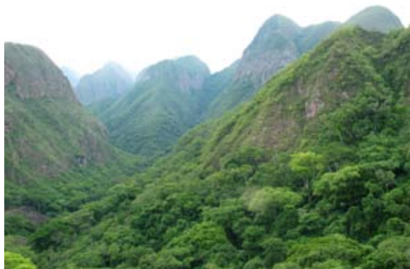
"El Cañadón" cerca a Bella Vista

El programa está dirigido a contabilizar, registrar y verificar las compensaciones de carbono resultantes del Proyecto. El año 2006 se ejecutó