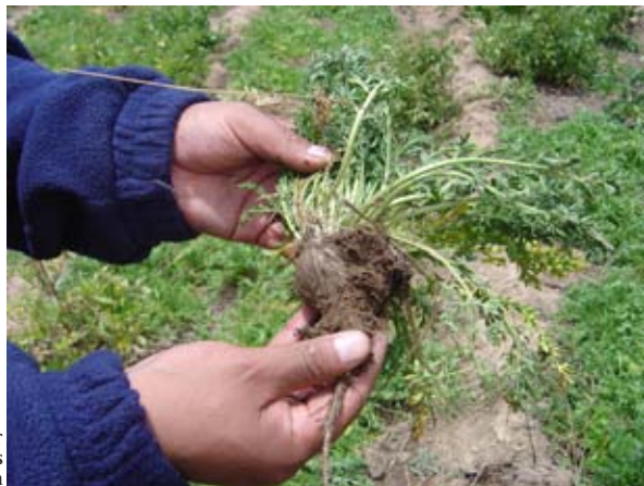
Productor con raíces de maca