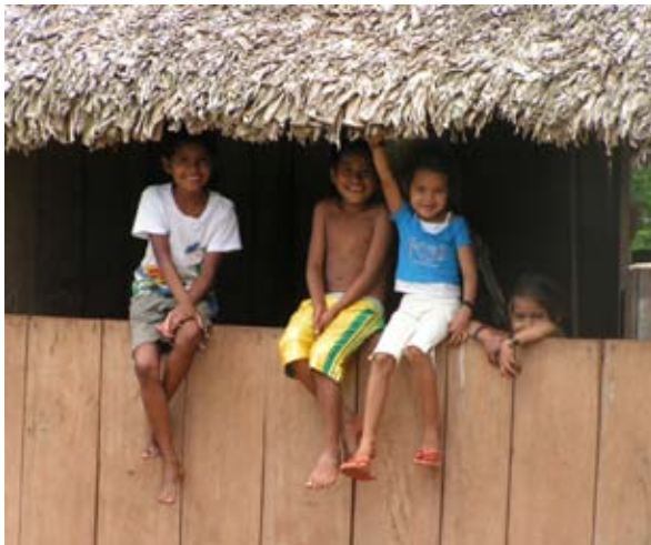
Niños Bajo Paraguá

En el sitio del proyecto se implementa hace tres años un sistema participativo de monitoreo sistemático de fuego y de focos de calor, que el 2006 ha logrado que no se registre ningún incendio de origen antrópico.