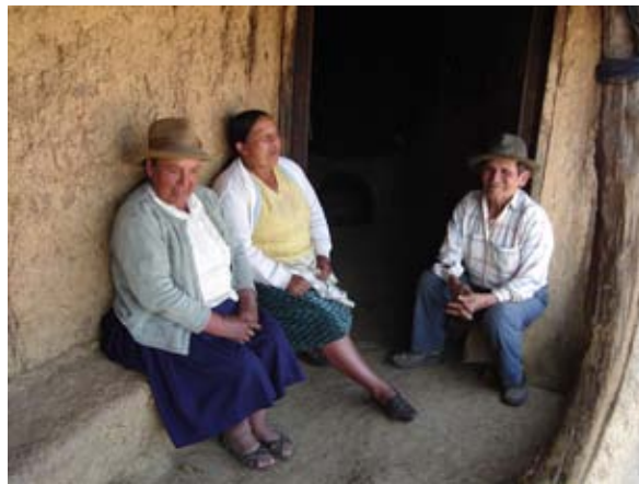
Comunidad La Jara

Tres gobiernos municipales han insertado en su plan operativo anual proyectos demandados por las comunidades -que han sido elaborados con su participación- los cuales serán co-financiados con la Unidad de Gestión Territorial. El municipio de Comarapa destinará fondos para actividades de educación no formal.