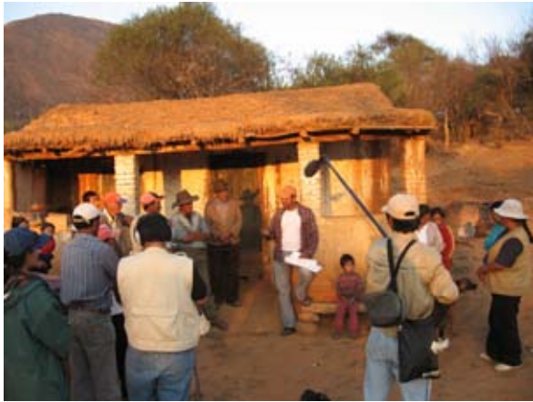
Durante la producción de video en Cabra Cancha