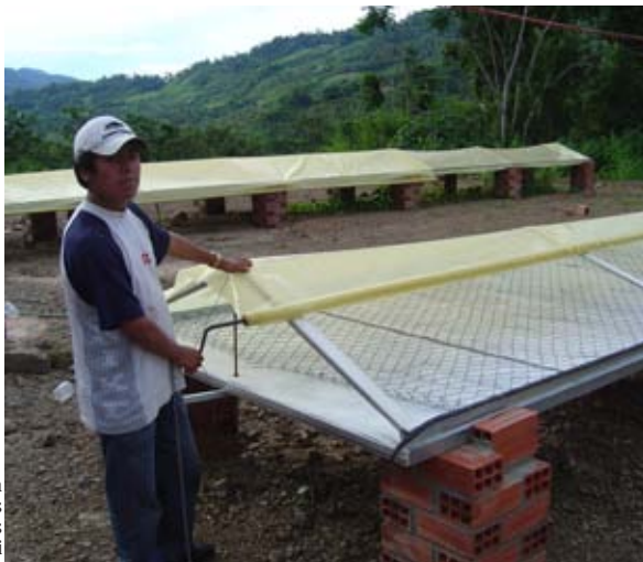
Panel para secar hierbas aromáticas en Caranavi

En la gestión 2006 dos aviones efectuaron 259 horas de vuelo. Se logró la autosostenibilidad.